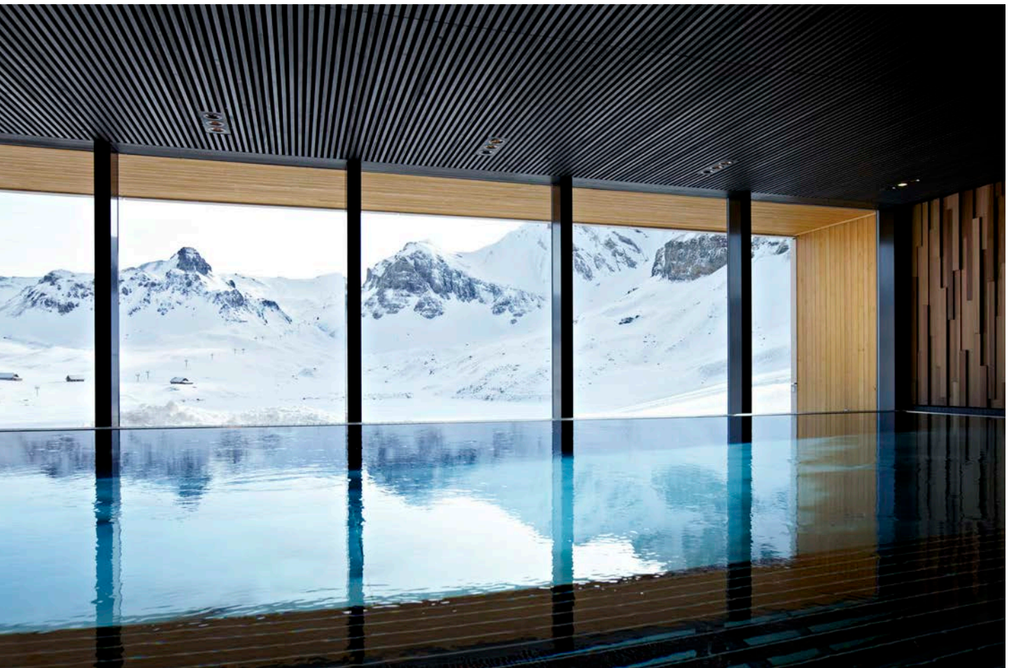
Zur Fensterseite hin konstruierten die Poolexperten der Firma Vivell + Co. eine freie Überlaufrinne, die den Ausblick in die weite Natur und die Berge erlaubt.