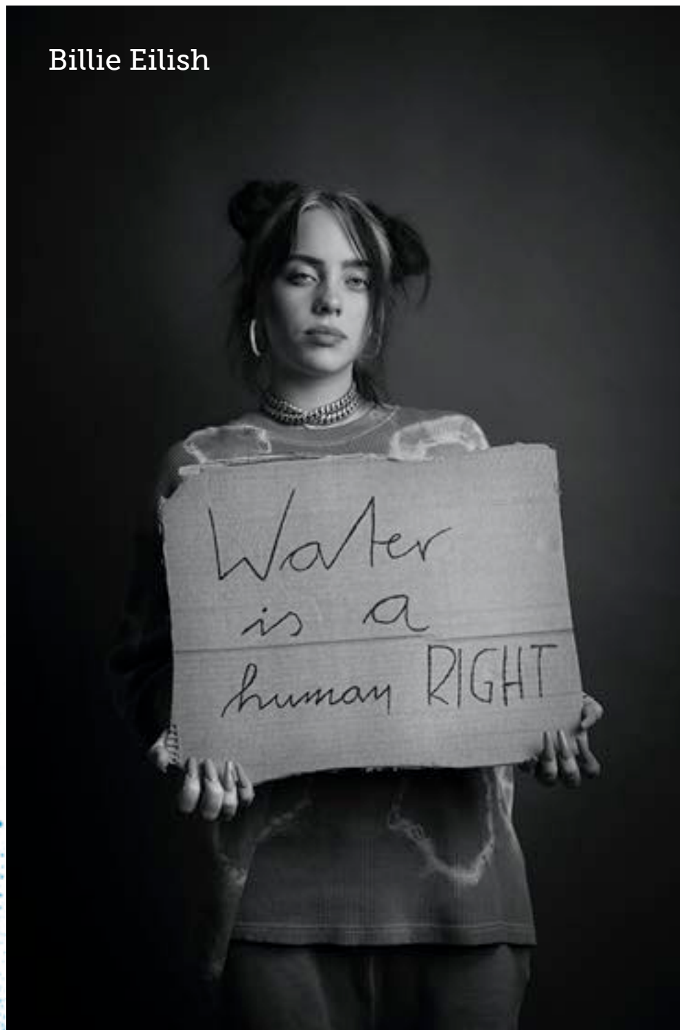
Lo & Leduc